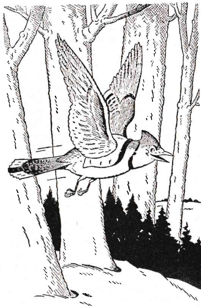
Sami era vesel nevoie mare.

Cămara aceasta fusese pe vremuri cuibul lui Cioară Negruțu. Când acesta se mutase altundeva, Trăncănel transformase cuibul în depozit. Îi pusese acoperiș, iar de-a lungul zilelor blânde de toamnă tot înghesuise în el nuci și ghinde. Sami îl urmărise de multe ori și știa exact câte nuci și